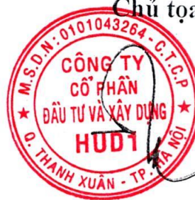
Dương Tất Khiêm